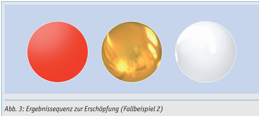
Abb. 3: Ergebnissequenz zur Erschöpfung (Fallbeispiel 2)

und morgens immer seltener erholt. Mit der ständig größer werdenden inneren Unruhe und der Sorge um ihre Leistungsbereitschaft an ihrem Arbeitsplatz kommt sie in die Praxis. In ihrem Fall nutzen wir wiederum die Bio12Code-Frequenzmuster als Wegweiser hin zu real erlebter Stimmigkeit. Auch Erika wird als Erstes mit einer MPV®Sun-Analyse konfrontiert.